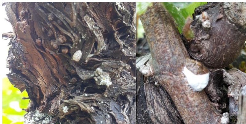
Cochenille du platane / Cochenille pulvinaire

Différentes espèces de cochenilles sont repérables par la présence de fourmis.