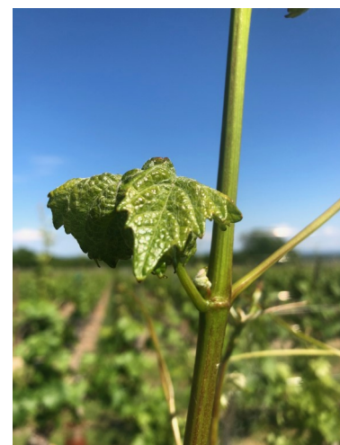
Feuilles des 10-12èmes étages foliaires sur pinot noir