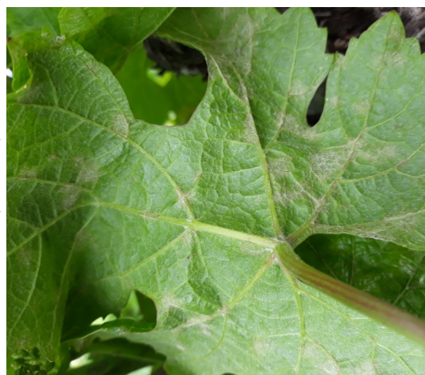
Symptôme foliaire Blienschwiller

La floraison est un stade de vigilance maximale. Le palissage favorise l'entassement de la végétation et crée un milieu plus propice à l'oïdium mais permet aussi de répartir la végétation également sur l'ensemble du plan de palissage.