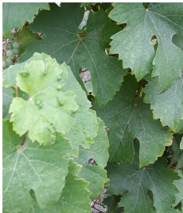
Erinose sur jeunes feuilles