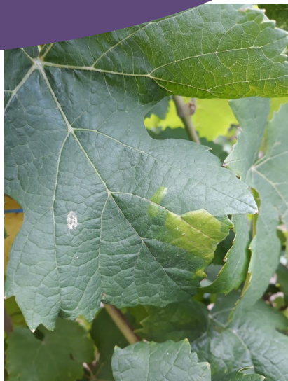
Symptôme de cicadelle des grillures