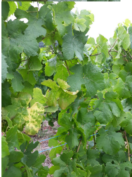
Symptômes de bois noir (enroulement ,nervures jaunes)

Ce bulletin est produit à partir d'observations ponctuelles réalisées sur un réseau de parcelles. S'il donne une tendance de la situation sanitaire régionale, celle-ci ne peut pas être transposée telle quelle à chacune des parcelles.