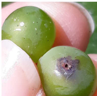
Ponte éclos (baie de gauche) et la perforation