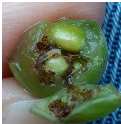
Larve dans la baie