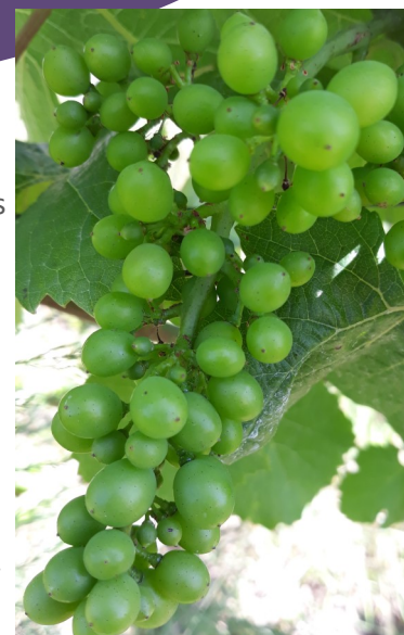
Stade petit pois