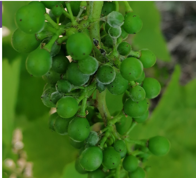
Symptômes sur grappe

L'effeuillage est une méthode alternative complémentaire qui améliore la qualité de pulvérisation et expose les grappes à la lumière.