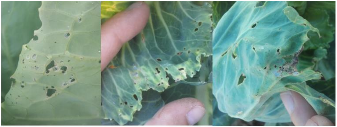
Dégâts de charançon gallicole (A. CLAUDEL)