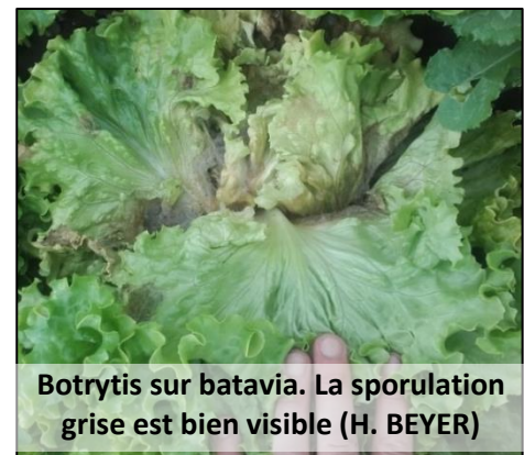
Botrytis sur batavia. La sporulation grise est bien visible

Les infections par le botrytis sont favorisées par une forte fertilisation azotée ainsi que par les blessures (y compris des pucerons) qui sont des points d'entrée de la maladie. L'espacement des têtes (10/m 2 au lieu de 12 ou 14) permet d'améliorer la ventilation de la culture et de diminuer la pression. La plantation sur plastique isole les feuilles du sol ce qui limite aussi l'infection.