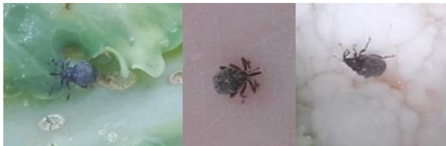
Charançon de la tige du colza (1 ère photo) et charançon du chou (les 2 photos suivantes)

Niveau de risque : moyen sur chou au stade inférieur à 50% de pomaison