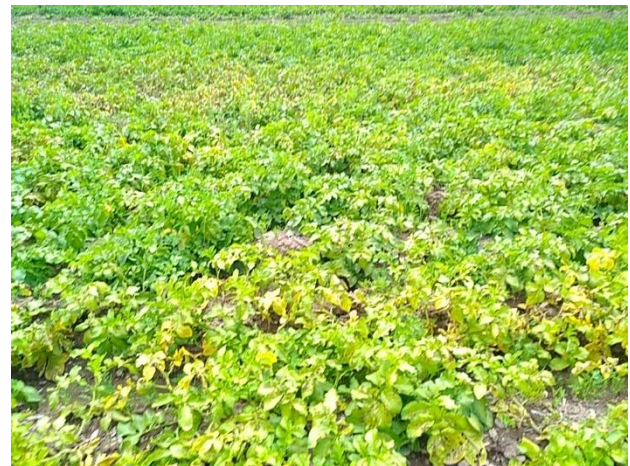
Virus Y sur feuille à gauche sur Annabelle, à droite, Adora à maturité avec alternaria. (D. Jung)