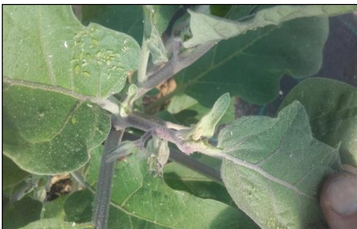
Colonie en développement de pucerons verts sur aubergine (H. BEYER)

Le risque reste globalement moyen , mais il est variable d'un site à l'autre selon la culture considérée et le niveau de développement des auxiliaires.