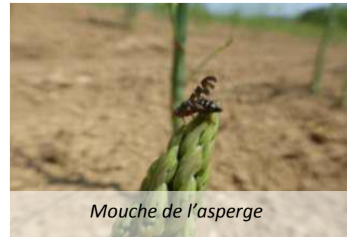
Mouche de l'asperge

Le vol touche à sa fin. Quelques dégâts sont visibles sur des parcelles, mais plutôt faibles, exceptées quelques parcelles fortement touchées.