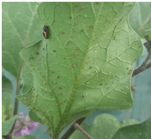
Larve de coccinelle et pucerons parasités (momies beige-doré) sur feuille d'aubergine (L.HUSSON)