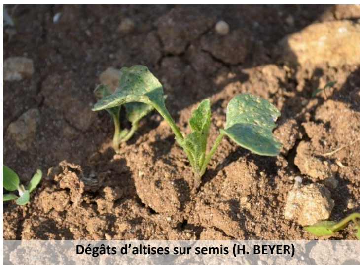
Dégâts d'altises sur semis (H. BEYER)

Les observations sur crucifères pour cette semaine ont été réalisées sur trois sites sur les secteurs de Toul, Nancy et Lunéville. Aucun foyer de puceron n'a été observé, et peu d'altises sont présentes sur les choux bien que les dégâts soient parfois importants. Quelques aleurodes sont également observés, mais la pression reste faible.