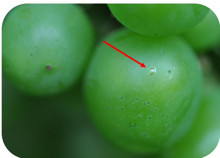
Œuf d'eudémis (irisé)

En secteurs non confusés, le risque G2 est maintenant présent et à prendre en compte dès maintenant.