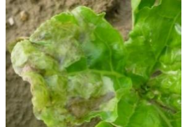
Galeries de pégomyies