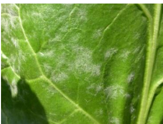
Oïdium : mycélium blanc grisâtre poudreux.