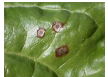
Cercosporiose : taches grises avec une bordure rouge ou brunâtre, avec présence de points noirs au centre. Contrôler à la loupe la présence de points noirs.