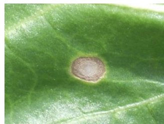
Ramulariose : taches brunes avec liseré sombre présentant au centre de petits points blancs. Contrôler à la loupe la présence de points blancs.