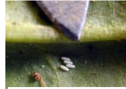
Oeufs de pégomyies

Malgré l'observation de ponte la semaine dernière, le risque pégomyies reste toujours à un niveau faible. La présence de galeries est observée sur 4 parcelles avec une fréquence nettement en dessous du seuil de risque.