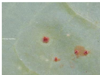
Rouille : pustules poudreuses orangées