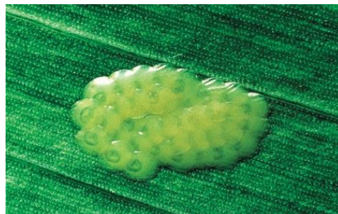
Pyrale sur plaque engluée (CA76) et œufs de pyrale (ARVALIS-Institut du Végétal).

Le pic de vol étant en cours, il est possible d'observer les pontes (œufs déposés par plaque de 20 à 30) sur la face inférieure des feuilles le long de la nervure centrale. A noter que la hausse des températures et de l'hygrométrie est favorable aux pontes de pyrales : surveillez donc vos parcelles actuellement.