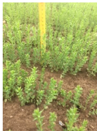
Photo : Hervé GEORGES – CA 80 : Parcelle de lin à 8 cm dans la Somme (80)