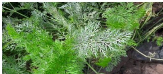
Symptômes d'oïdium sur feuilles de carotte

L'oïdium est de plus en plus présent sur les parcelles du réseau. À Emmerin (59), 40% des plantes présentent entre 1 et 5 % de feuilles malades. À Loizy (02), 80 % des plantes comportent entre 5 et 20 % de feuilles touchées par la maladie. Pour rappel, l'oïdium se caractérise par l'apparition de taches poudreuses d'un blanc-grisâtre sur la face supérieure des feuilles. Les facteurs favorables à la maladie sont un temps chaud et orageux, un développement excessif du feuillage et une humidité nocturne. Surveillez vos parcelles car le seuil de nuisibilité est atteint dès l'apparition des premiers foyers, la maladie se développant rapidement.