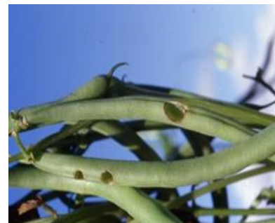
Dégâts sur gousses d' Heliothis