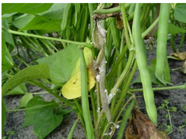
Symptômes de Sclérotinia sur gousses de haricot