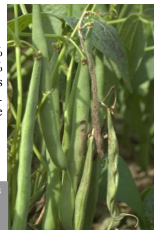
Symptômes de botrytis sur gousses de haricot

Deux parcelles sont concernées par la maladie. À Dompierre Bécquincourt (80), 12 % des plantes sont faiblement touchées par le botrytis. À Bucy Les Pierrepont (02), 20 % des plantes présentent entre 3 et 4 symptômes. La maladie provoque des taches nécrotiques sur les tiges et les feuilles et une pourriture molle et grise sur les gousses. Elle est favorisée par des températures moyennes et une forte hygrométrie. Pour être efficace, la lutte doit être préventive dès le stade floraison.