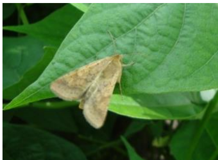
Papillon Heliothis sur feuille de haricot