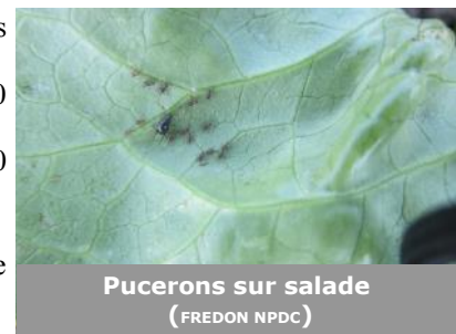
Pucerons sur salade (FREDON NPDC)

Le temps devrait continuer à être favorable aux pucerons cette semaine. Surveillez vos parcelles et vérifiez la présence d'auxiliaires.