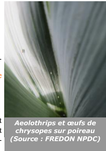
Aeolothrips et œufs de chrysopes sur poireau

10 teignes ont été capturées à Trosly-Breuil (60) et Bichancourt (02). Les captures sont donc constantes sur le premier site alors qu'elles diminuent sur le second. Aucun dégât n'est signalé actuellement mais pourraient être visibles. Pour rappel, le seuil de nuisibilité est atteint dès la présence de chenilles.