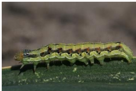
Chenille d' Heliothis