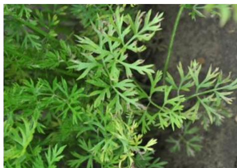
Symptômes d'Alternaria sur feuilles de carotte

Tous les secteurs de production sont concernés par l'alternaria. À Loizy (02), Emmerin (59) et Baralle (62), de faibles attaques (entre 1 à 5 % de feuilles malades) sont observées avec respectivement 10 %, 16 % et 20 % de plantes touchées. Pour rappel, la maladie se caractérise par l'apparition de petites taches décolorées sur le bord des folioles, qui se dessèchent et donnent ensuite l'aspect de brûlures. Les feuilles vieillissantes ou affaiblies sont les premières touchées. La maladie est favorisée par un temps chaud et humide (orage, irrigations). Restez vigilants car il est difficile de contenir la maladie, une fois qu'elle s'est déclarée.