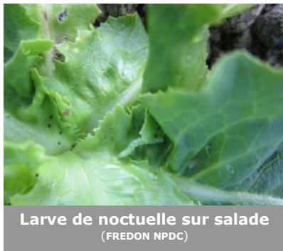
Larve de noctuelle sur salade

Les captures de noctuelles ( Autographa gamma ) ont fortement diminué sur l'ensemble de la région : 6 ravageurs/parcelle en moyenne contre 15 la semaine précédente. Seuls les sites d'Ennetières-en-Weppes (59) et Calonne-sur-la-Lys (62) ont connu une légère augmentation de leurs captures.