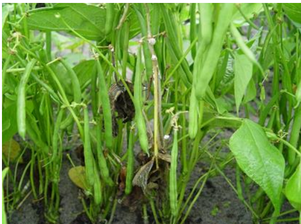
Symptômes de Sclérotinia sur tige de haricot

Le sclérotinia est de plus en plus présent dans les parcelles de haricots et de flageolets. La plupart des parcelles qui se rapprochent de la récolte sont concernées par la maladie même si la protection fongicide a été correctement réalisée. À Balinghem (59), 12 % des plantes sont faiblement touchées par la maladie. À Dompierre Bécquincourt (80), 36 % des plantes comportent entre 1 et 2 symptômes, 16 % entre 3 et 4 et 8 % plus de 4 symptômes. Pour rappel, le sclérotinia apparaît généralement à partir de la floraison sous forme de taches humides et irrégulières sur les tiges et les gousses qui évoluent en mycélium blanc. Une extension rapide de ce mycélium entraîne la mort de tout ou partie de la plante. Il existe une solution de biocontrôle pour lutter contre cette maladie sous forme de traitement de sol à appliquer préventivement avant le semis. Différents OAD disponibles en ligne comme HASCLERIX® ( www.hasclerix.fr ) ou SCAN BEAN® permettent de gérer le risque sclerotinia sur haricot.