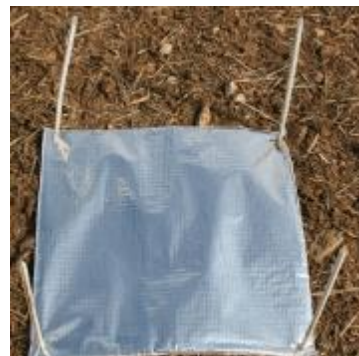
Piège à limace.

Cette observation nécessite une attention particulière. En effet, le relevé des pièges doit s'effectuer en début de matinée en conditions fraîches et humides et en «grattant» la terre sous les pièges car les limaces sont généralement abritées entre les mottes dans les premiers cm du sol.