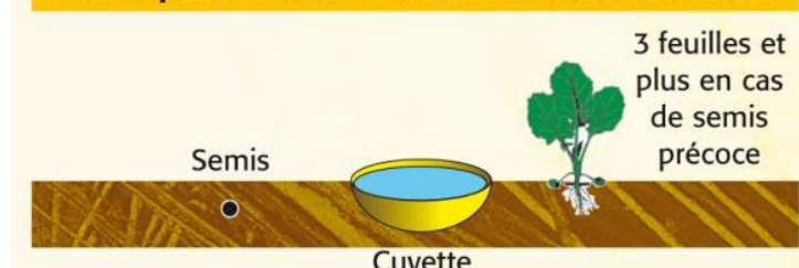
Schéma de la disposition de la cuvette jaune pour capturer l'altise d'hiver.

Pour capturer l'altise d'hiver, la cuvette est enterrée