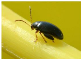
Grosse altise adulte

Il s'agit d'un gros coléoptère de 3 à 5 mm de long au corps noir et brillant avec des reflets bleus métalliques sur le dos. Les extrémités des pattes, des antennes et de la tête sont roux dorés. Elle est reconnaissable aussi par des « grosses cuisses » qui lui permettent de sauter pour se déplacer dans la parcelle.