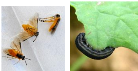
Tenthrede à l'état adulte (gauche) et larvaire (droite)

La tenthrède est un hyménoptère qui à l'état adulte mesure 7 à 8 mm, présente un corps jaune orangé, à tête noire et aux ailes membraneuses. La larve mesure 20 à 50 mm. Elle est translucide, grisâtre voire verdâtre. Elle prend un aspect noirâtre en fin de développement et devient nuisible pour la culture en dévorant les feuilles.