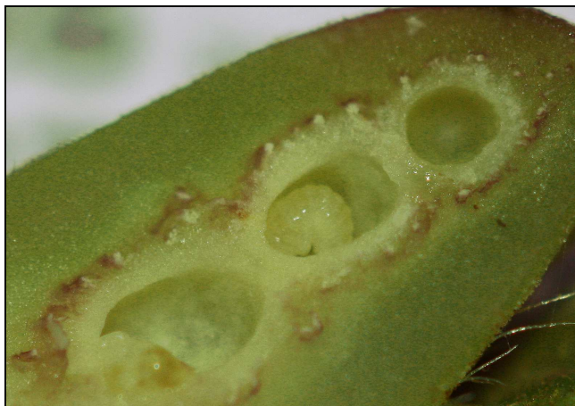
En Sud-Corrèze : Larve de Cynips du châtaignier ( Dryocosmus kuriphilus ) dans sa galle sur variété Marigoule, le 02/05/2013. Notez la présence de plusieurs loges dans une seule galle.

Les larves se nourrissent pendant 20 à 30 jours dans les galles (voir photo ci-dessous) avant de se nymphoser.