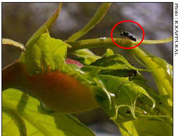
En Sud-Corrèze, le 02/05/2013 : Suite à un lâcher de l'auxiliaire, adulte de Torymus sinensis à proximité d'une galle de cynips. La femelle pondra directement dans cette galle afin de parasiter la larve du ravageur : on parle alors d'hyperparasitisme.

Au printemps 2013, dans le cadre du projet CASDAR coordonné par le CTIFL, la FREDON Limousin a participé aux lâchers de Torymus sinensis en Corrèze (voir photos ci-dessous), afin d'acclimater l'hyperparasite sur des parcelles déjà attaquées par le Cynips. D'autres lâchers sont organisés par la FREDON Midi-Pyrénées, le CTIFL de Lanxade et Invenio de Douville, sur le grand sud-ouest. Un travail d'optimisation de l'implantation de Torymus sinensis est en cours. Les Torymus relâchés proviennent de galles prélevées sur des vergers du sud-est et mis en élevage par l'INRA de Sofia-Antipolis (Antibes).