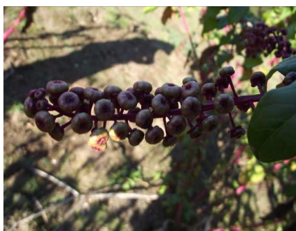
Baies de Phytolacca americana

En Pays de la Loire, le raisin d'Amérique observé en mai dans le Haut Anjou présente une forte croissance, atteignant 60 centimètres de haut.