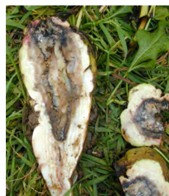
Erwinia (archives 2004)

La dégradation totale des tissus entraîne une pourriture humide qui s'accompagne d'une odeur pestilentielle.