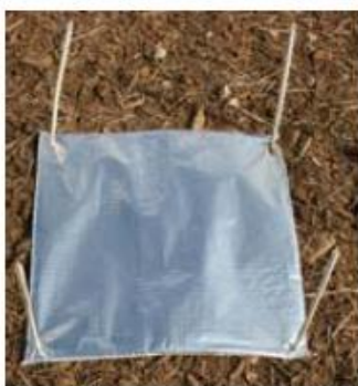
Piège à limaces, face aluminium visible

A partir de la levée, le seuil de nuisibilité est atteint lorsque plus de 20 % des plantules de la céréale affichent des attaques de limaces.