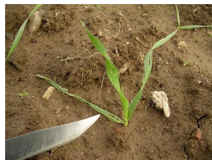
Plantules effilochées par les limaces