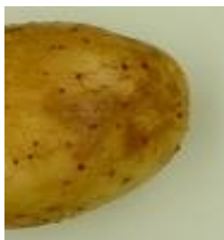
UK ↑ Dartrose