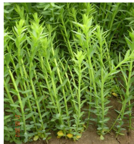
Photos (Arvalis – F. Bert) : certains lins sont entre D1 (10 cm) et D2 (20 cm). D'autres atteignent déjà D4 (40 cm).