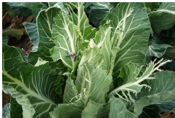
Chou abimé par des pigeons (FREDON BN)

Des attaques de pigeons sont constatées sur les deux parcelles observées (28 % des jeunes plants de choux verts ont des « morsures » de pigeon).