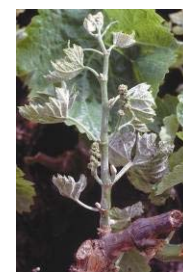
Drapeau sur Carignan

Estimation du risque : moyen sur Carignan, faible sur les autres cépages.