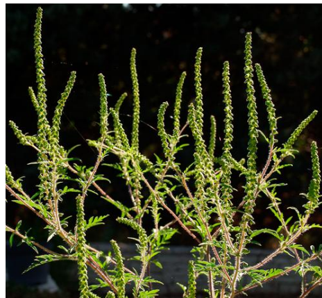
Inflorescence de l'ambroisie à feuilles d'armoise (www.ambroisie.info )