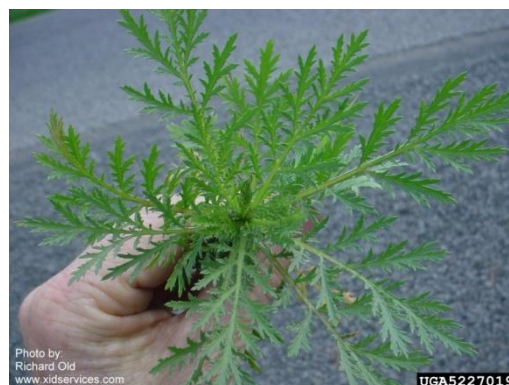
Artemisia biennis (Richard Old)

L' Artemisia biennis (Armoise bisannuelle) est souvent confondue avec l'Ambrosie à feuilles d'armoise. La couleur de la feuille d'Armoise est différente entre sa face inférieure et supérieure contrairement à l'Ambrosie à feuille d'armoise. De plus, lorsque l'on froisse ses feuilles, dégage une odeur marquée que l'on ne retrouve pas chez l'ambrosie à feuille d'armoise.