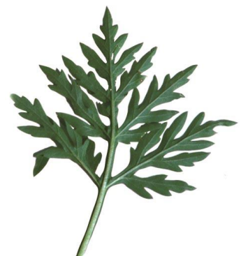
Feuille de l'ambrosie à feuilles d'armoïse ( www.ambrosie.info )

Si vous répondez "oui" à toutes les questions, continuez avec les questions suivantes. Si vous répondez "non" à une ou plusieurs questions, alors ce n'est probablement pas l'ambrosie. Consultez la liste des espèces qui peuvent être confondues avec l'ambrosie.