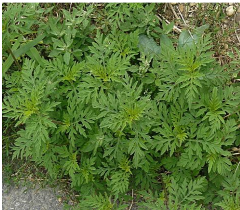
Ambroisie à feuilles d'armoise en croissance végétative

L'ambroisie à feuilles d'armoise ( Ambrosia artemisiifolia L.) est une plante annuelle dont le pollen, émis de fin juillet à octobre, est très allergisant pour l'homme (6 à 12% de la population exposée est allergique). Originaires d'Amérique du Nord, l'ambroisie a été observée pour la première fois en France au milieu du XIXème siècle. Cette plante exotique s'est depuis parfaitement acclimatée, au point de devenir fortement envahissante dans plusieurs régions françaises où elle pose des problèmes de santé publique. En zone agricole, elle cause également des pertes de récoltes (tournesol et maïs notamment).