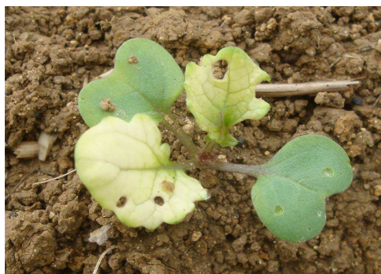
Décoloration clomazone et morsures de grosses altises sur colza - Sophie Cappe - CA02

La présence de morsures est plus faible (1/4 des parcelles contre 2/3 au dernier BSV). Pas de dépassement de seuil sauf en bordure d'une parcelle (90% de plantes avec morsures de petites altises) et dans une parcelle mais cette dernière est hors de période de sensibilité.