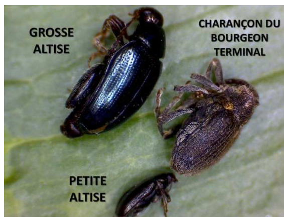
Altises et Charançon du bourgeon terminal - Cetiom

Peu de captures comme la semaine dernière : 1 à 2 individus piégés dans 5 parcelles (7 au dernier BSV) proche de : Cagny, Catenoy, Ham, Soyécourt et Sissonne. Le risque est pour l'instant toujours faible mais il faut rester vigilant sur l'évolution des vols. Rappel : le charançon du bourgeon terminal s'observe très difficilement sur plantes. Une cuvette jaune à hauteur de végétation est indispensable. Il se reconnaît par son corps noir et brillant, sa pilosité courte, ses tâches latérales blanches et ses extrémités de pattes rouges.