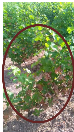
MT - 01/07/19 Folletage sur Sauvignon Sancerre