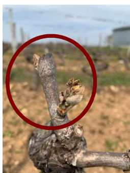
AR – Cabernet à Chinon Bourgeons gelés du « 04/04/19 »

L'épisode de froid intense du weekend dernier, n'a pas provoqué de dégâts significatifs hormis quelques parcelles localisées (Huisseau/Cosson....). Les hygrométries basses ont permis de minimiser les impacts sur cette séquence.