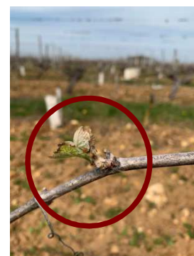
AR – Cabernet à Chinon Bourgeons partiellement gelés du « 04/04/19 »