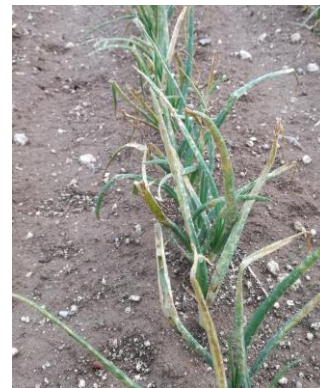
Dégâts de grêle sur oignons

Stemphyliose : risque modéré sur les parcelles touchées par les intempéries.