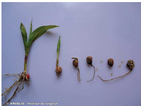
Attaque de mouche de semis À gauche : une plante saine À droite : des graines présentant des problèmes de germination, graines envahies par les asticots de la mouche des semis

La mouche apprécie les situations froides et humides où le maïs végète. La matière organique fraîche en décomposition est un autre facteur favorisant sa pullulation. La présence de la mouche n'est pas toujours la première cause des dégâts, mais souvent la conséquence de problèmes de levée en situations froides et humides (associée à un milieu favorable : débris organiques).