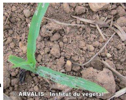
Attaque due aux limaces (les feuilles sont trouées – les nervures sont intactes)

Le but de la mise en place d'une surveillance sur les limaces est d'évaluer le risque de la parcelle. Cette surveillance est effectuée grâce à des pièges (taille de 0.25 m 2 ). Des pièges peuvent être achetés auprès de distributeurs ou il est possible de les fabriquer. Pour les réaliser, un carton ondulé doit être appliqué sur le sol, après l'avoir humidifié et recouvert d'une feuille plastique. Les pièges doivent être relevés le matin (avant 8h). Sinon, des micro-granulés peuvent être disposés sous le piège pour faciliter l'observation.