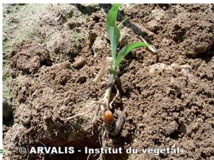
Asticot de tipule au pied d'une plante de maïs de 3 feuilles. La plante ne semble pas avoir été affectée.

Le risque va probablement diminuer car les larves vont se nymphoser. De plus, la présence de larve n'implique pas automatiquement de gros dégâts car les larves sont surtout détritiphages.