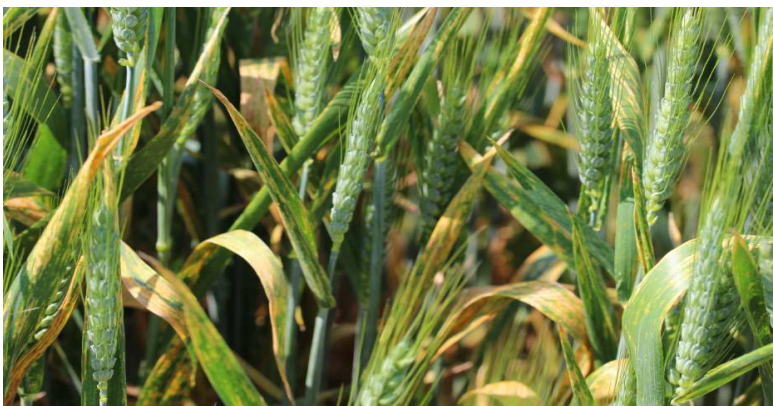
Rouille jaune sur Altigo (non traitée)

Cette semaine, 7 cas sont encore signalés sur l'ensemble de la région, contre 10 la semaine précédente. Trois de ces parcelles n'ont pas reçu de traitement. Les variétés concernées sont : Ephoros (x2), Paledor (x1), Barok (parcelle non traitée x1) et Atlass (parcelle non traitée x1).