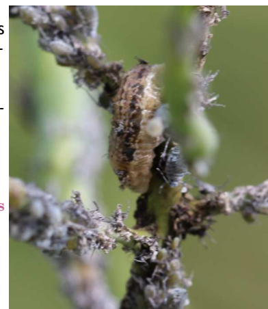
Larve de syrphe dans une colonie de pucerons cendrés

Seuil de nuisibilité : Deux colonies / m 2 .