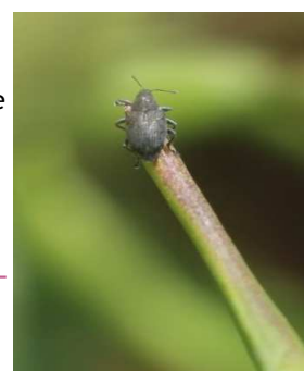
Charançon des siliques

Seuil de nuisibilité : Plus d'un charançon sur 2 plantes à l'intérieur des parcelles.