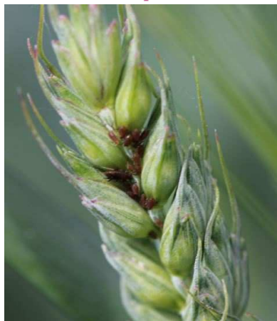
Puceron des épis des céréales ( Sitobion avenae )

Seuil de nuisibilité : un épi sur deux colonisés par au moins un puceron.