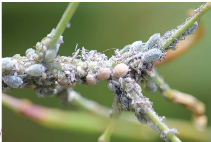
Colonie de pucerons cendrés sur colza et présence de pucerons momifiés

Retrouvez les BSV sur le site de la Chambre Régionale d'Agriculture ou le site de la DRAAF www.bulletinduvegetal.synagri.com http://draf.bretagne.agriculture.gouv.fr