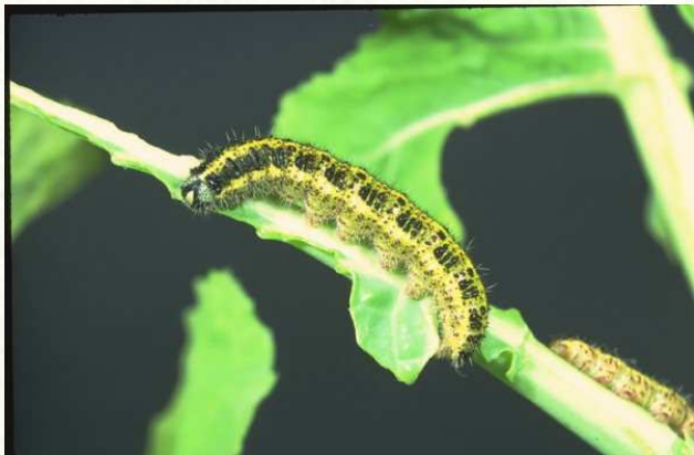
Chenille de la piéride du chou (HYPPZ - INRA)