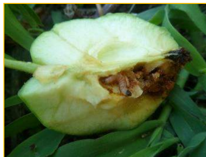
Larve dans le fruit