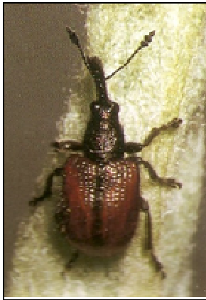
Adulte de Rhynchite rouge

On observe sur quelques parcelles la présence de rhynchites rouges et des piqûres sur fruits.