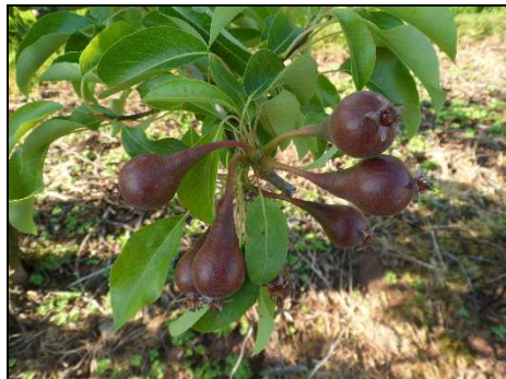
Stade J à basculement du fruit – 04/06

Stade J « grossissement du fruit » pour l'ensemble des variétés en tout secteur.