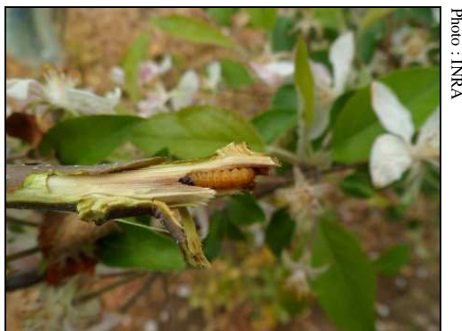
Larve de zeuzère

Les larves (chenille de couleur jaune clair, tachetée de noir) déjà présentes dans les branches sont actuellement dans la phase de nymphose.