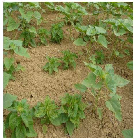
Symptômes de mildiou (Photo : CETIOM)

http://www.cetiom.fr/tournesol/cultiver-du-tournesol/maladies/mildiou