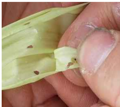
Pyrale de 2 mm provoquant le symptôme coup de fusil (trous alignés)

La gestion biologique de la première génération de ce ravageur à l'aide de trichogrammes est possible dès l'observation des premières pontes sur vos parcelles.