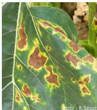
Dégâts foliaires de verticillium (Photo : CETIOM)

Évaluation du risque : risque très localement élevé. Le risque est à évaluer à la parcelle. Surveillez très attentivement vos parcelles.