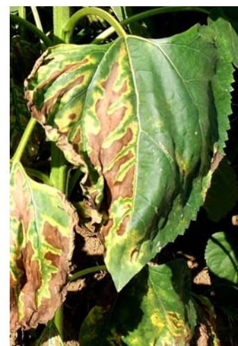
Dégâts foliaires de verticillium