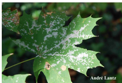
Oïdium sur Erable

En revanche, ces champignons peuvent affaiblir les arbres atteints si des attaques fortes et des défoliations importantes ont lieu pendant plusieurs années successives.