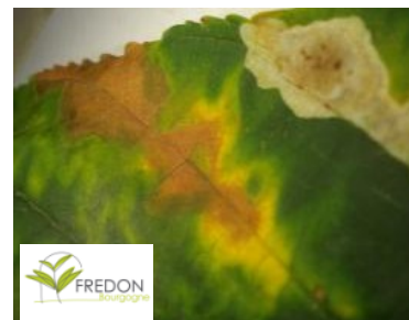
Black Rot sur marronnier

Sur les rosiers, des développements d'oïdium (feutrage blanc sur feuilles ou tiges) et de taches noires sont observés. Les conditions climatiques sont favorables à la propagation de ces maladies. Les dégâts sont surtout esthétiques.