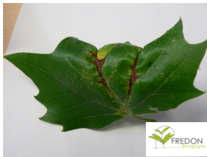
Anthracnose sur platane