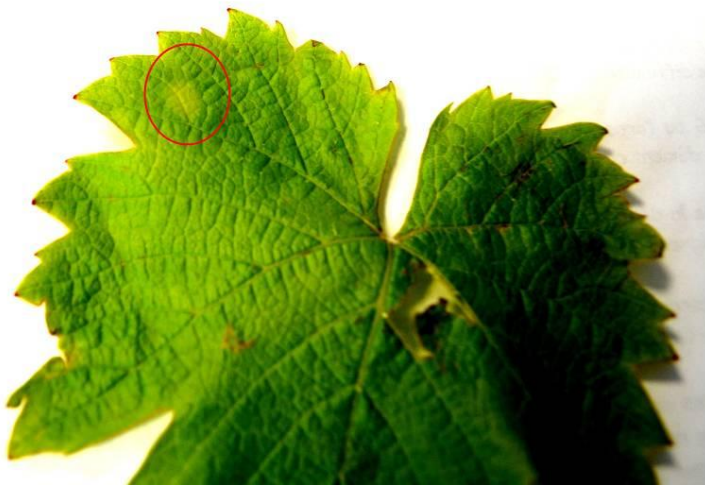
Première tache de mildiou au 13 mai 2014

On peut par conséquent considérer que les dégâts liés au champignon ont été minimes en 2014.