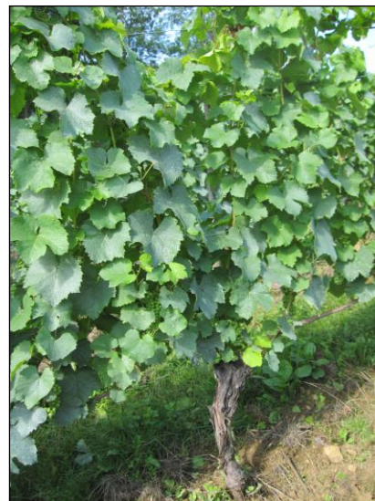
Stade phénologique moyen de la vigne en Lorraine au 25 juillet 2011